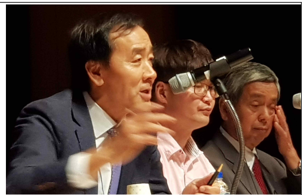
참석자 질의응답 및 토론