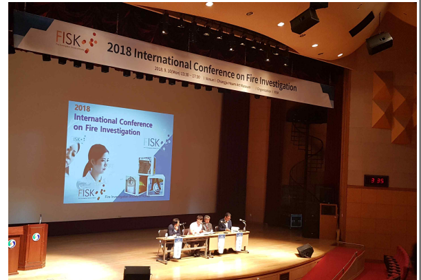
2018 국제 화재감식컨퍼런스 장면