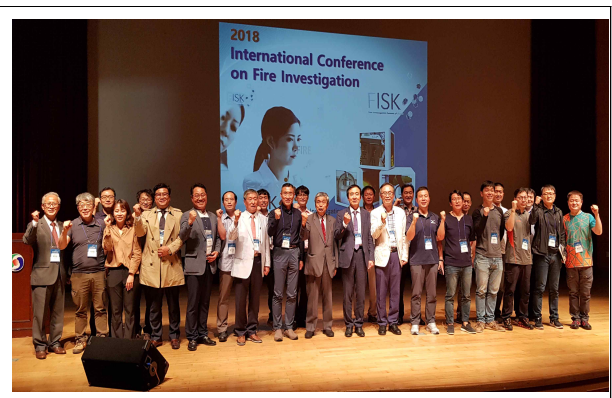
폐회 및 기념촬영